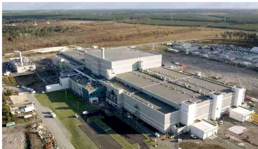
Bâtiment du LMJ en 2008

Implanté en Aquitaine (centre CESTA), c'est une installation qui fournira à l'aide de 176 faisceaux laser de très forte puissance plusieurs centaines de térawatts (1 térawatt = 1 million de millions de watts). Le laser mégajoule (LMJ) et son prototype, la ligne d'intégration laser (LIL), mettront leurs performances à la disposition de la communauté scientifique européenne qui disposera alors de moyens expérimentaux uniques dans le monde : le LMJ, dont les premières expériences commenceront en 2014, deviendra dans les années suivantes le plus puissant laser existant avec le NIF (National Ignition Facility) américain.