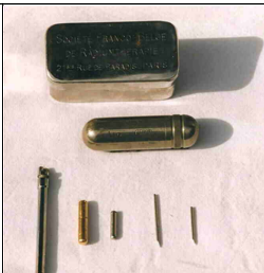
Produits contenant du radium Société Franco-Belge de Radiothérapie

En 1990, le potentiel radium résiduel est estimé à 120 Ci.