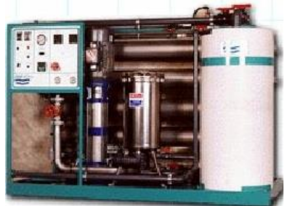
Eau potable par filtration membranaire