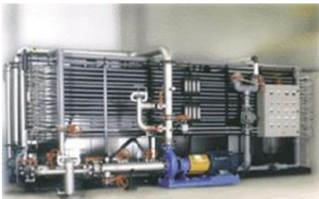
Dessalement eau de mer par osmose inverse

Les recherches récentes, menées dans le cadre des diverses collaborations internationales du CEA, indiquent que, grâce aux techniques innovantes, le coût du dessalement effectué à partir de réacteurs nucléaires serait 30 à 60 % inférieur à celui du dessalement obtenu à partir des sources d'énergie d'origine fossile.