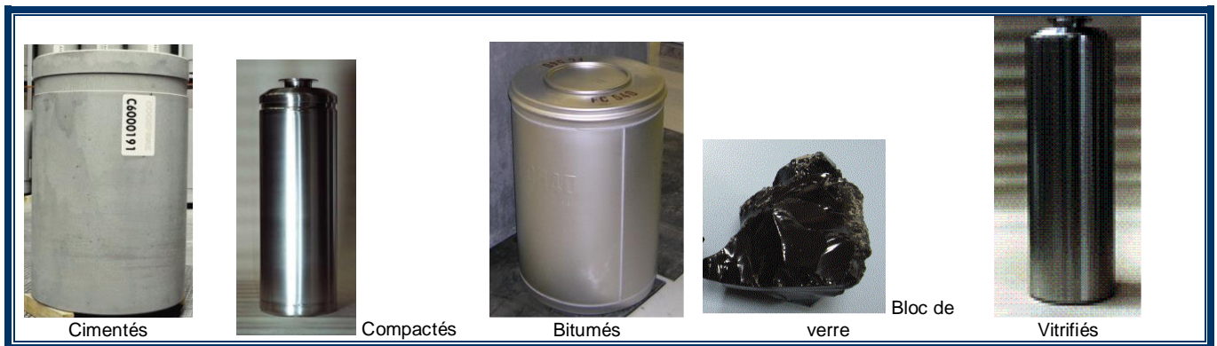
Différents types de colis de déchets