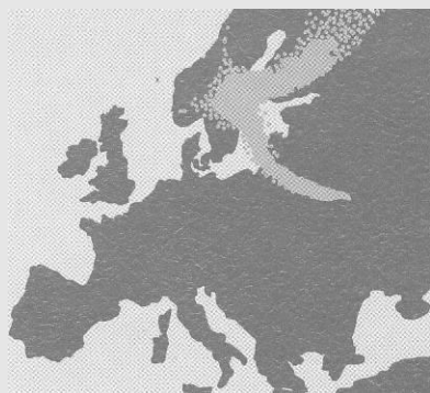
Panache à J+1