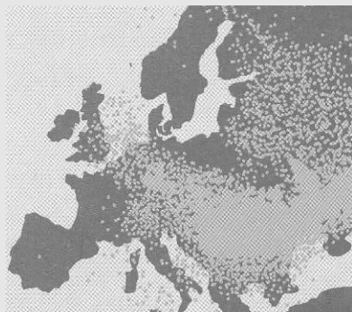
Panache à J+8