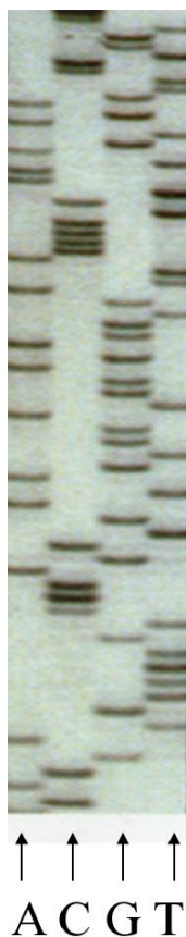
Figure 1 : Gel de séquence d'un brin d'ADN.